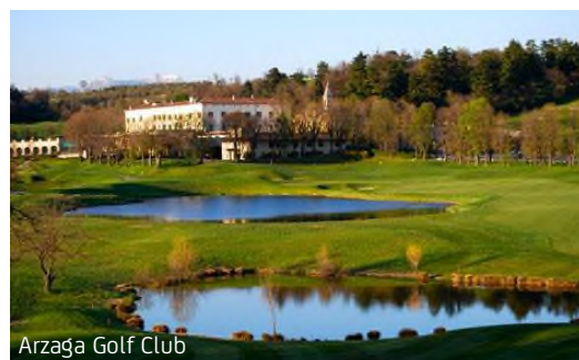
Arzaga Golf Club