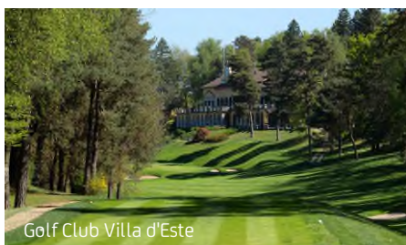
Golf Club Villa d'Este

In allegato troverete la Circolare del Torneo Sociale 2020 e i relativi Regolamenti.