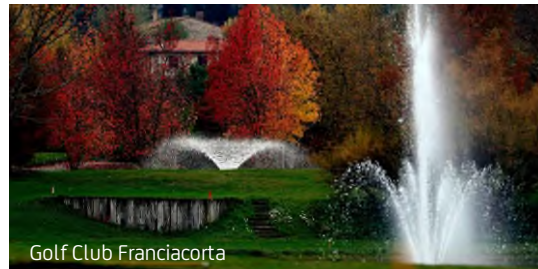
Golf Club Franciacorta

Contatta la Sezione Golf UniCredit Circolo Milano: