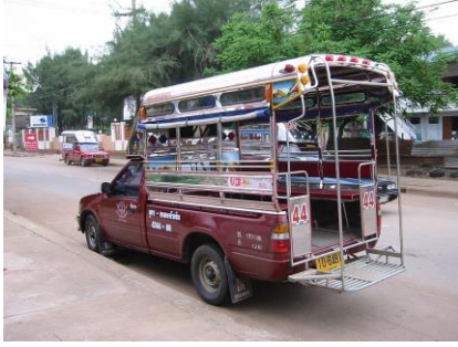
Bus Songthaew Chiang Mai